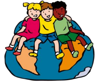
We horen bij elkaar

Tijdens blok 1 staat het samen werken aan een positief werkklimaat centraal. Naast de algemeen geldende schoolregels maken leerkracht en kinderen samen afspraken over hoe je met elkaar omgaat en over de inrichting en het ordelijk houden van de klas. Om van een school of klas een groep te maken, is het nodig dat elk kind het gevoel heeft dat hij/zij erbij hoort. Kinderen hebben iets met elkaar als ze elkaar goed kennen en elkaar waarderen. Ze leren over "opstekers" en "afbrekers". Je geeft een opstecker als je een aardige, positieve opmerking over iemand maakt. "Jij kan zo goed iemand helpen". Opstekers doen iets met je; je wordt er bijvoorbeeld blij van. Het tegenovergestelde van een opstecker is een "afbreker". Het is een onaardige, negatieve opmerking over iemand. De ander krijgt er bijvoorbeeld een vervelend gevoel van. De kinderen leren dat iedereen zijn mening moet kunnen uiten en verdedigen en iedereen respect moet hebben voor de mening van anderen.